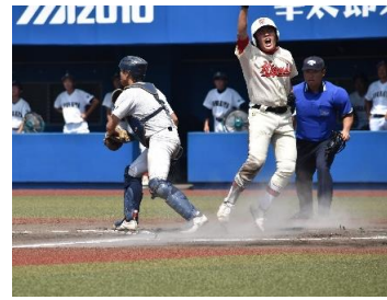
〔サヨナラのホームを踏む萩東中の選手〕