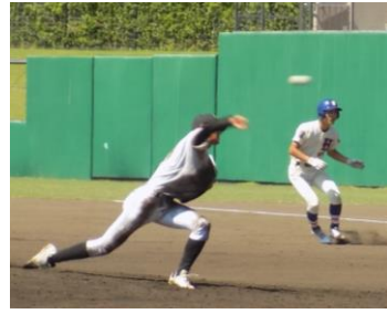
〔力投を見せた十日市中の投手〕