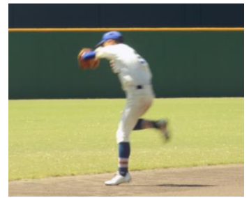
〔好捕を見せた浜山中の選手〕