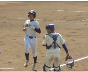
〔2点目のホームインをする十日市中の選手〕